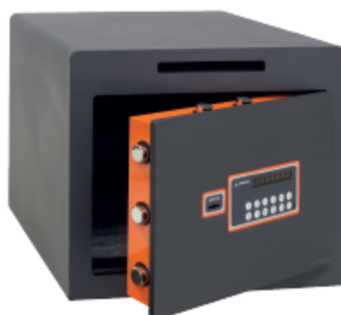
PLUS-C Τύπος 180050-SL

Λόγω της πιστοποίησης της κλειδαριάς του, η δημιουργία νέου κλειδιού μπορεί να γίνει μόνο με τη βοήθεια Ειδικού Τεχνικού εξουσιοδοτημένου από την ARREGUI. Είναι σημαντικό να αποθηκεύει η ιδιοκτησία του χρηματοκιβωτίου και να παρουσιάσει ένα αυθεντικό κλειδί, και η προσωπική κάρτα του χρηματοκιβωτίου.